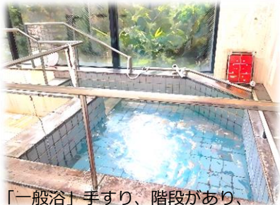
「一般浴」手すり、階段があり、安心して浴槽に入ることができます。