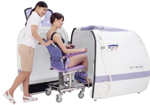
「ミスト浴」入浴チェアに座ったままでの入浴が可能です。入浴チェアごと浴槽内に入り、利用者毎にお湯を張ります。